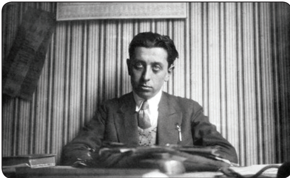
Robert Desnos en 1924

A u camp de concentration de Theresienstadt (Tchécoslovaquie), ce 8 juin 1945, à 5 h 30 du matin, Robert Desnos rejoignait à jamais la constellation des poètes. Épuisé par les conditions de détention et de transfert (Auschwitz, Buchenwald, Flöha), l'auteur est emporté par le typhus à l'âge de quarante-quatre ans. En 2025, Robert Desnos semble n'être qu'un simple nom sur le fronton de certaines écoles publiques française ou un vague souvenir du poème La Fourmi appris lorsque nous étions enfants.