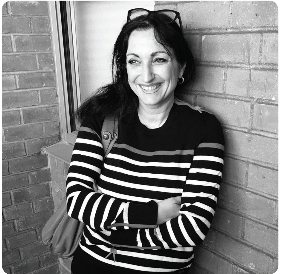
© Tous droits réservés — Sandrine Mehrez Kukurudz | L'Éponge.

Sandrine Mehrez Kukurudz : Mon mari avait fait ses études à UCLA en Californie. Il a toujours aimé l'Amérique et a toujours eu ce petit rêve secret d'y revenir. En 2005, pour des raisons personnelles et professionnelles, on s'est posé la question de tenter cette nouvelle aventure. Nos enfants étaient encore jeunes et la grande-fille de mon mari était adolescente et devenait de plus en plus indépendante. C'était donc une période où l'on pouvait relever le défi. Pour tester ce projet, nous sommes partis en famille vivre comme des Américains pendant six semaines. Nous en avons profité pour rencontrer toutes les connaissances que nos proches ou amis nous avaient recommandées. J'y ai aussi retrouvé deux amis de mes années universitaires. Nous avons observé comment tous ces gens vivaient, nous avons beaucoup échangé et nous sommes rentrés en France avec une décision : « On y va ! On relève le défi. » On a choisi alors Miami en Floride. Mais après quelques années, il nous fallait de nouveaux horizons. Nous pensions – à tort – que New York aurait été plus compliqué sur le plan professionnel et personnel. Nous imaginions que ce serait plus facile pour les enfants de les emmener dans un décor un peu idyllique. Pour nous, dans le domaine de l'événementiel, nous