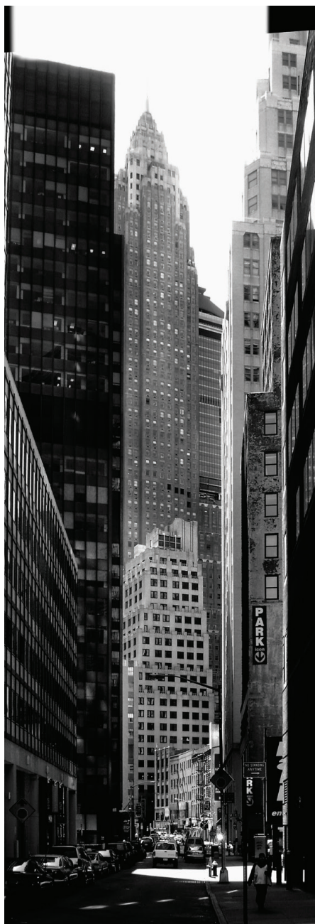
© Tous droits réservés — CharÉlie Couture / L'Éponge.

J'ai la double nationalité. J'ai les deux passeports. En tant que citoyen américain, je dois y déclarer mes revenus et payer les taxes. J'y vote aussi et bien sûr je continue à m'intéresser à tout ce qui se passe là-bas. Vu l'importance géostratégique des États-Unis dans la gestion du monde, il serait dramatique de redonner la commande de ce bulldozer surpuissant à ce Néron cinglé. À force de mensonges, Donald Trump a cari-