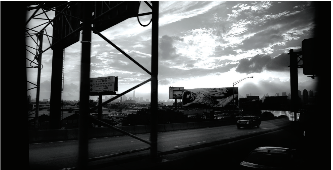
© Tous droits réservés — CharÉlie Couture / L'Éponge.

est une montagne à gravir. Plus la montagne est haute, plus ton challenge va être grand mais plus tu vas être admirable aussi. Alors les gens t'encouragent à te lancer des défis, et plus ton défi est grand plus tu es admirable. En France, on considère aussi que le présent est à la rencontre entre le passé et le futur, mais on va considérer le présent comme l'aboutissement du passé. En France, on juge le présent non pas par rapport à un projet mais par rapport à ce qui a déjà été réalisé. Aux États-Unis, le présent est la base du futur. New York est un patchwork d'états d'âme rempli d'une énergie comparable à ce qui se passe sur une piste dans un stade, New York est une ville de compétition. Qui donne à chacun l'envie de se réaliser. On dit qu'aux États-Unis, c'est pursuit of happiness , c'est-à-dire la quête du bonheur et c'est inscrit dans la Constitution. Mais il faut préciser aussi qu'on considère le bonheur comme étant l'accomplissement de soi-même.